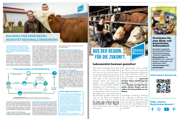
BILD-Beilage „So schmeckt Heimat“, daneben Seite aus der Süddeutschen Zeitung sowie Beitrag für Einkaufsführer Miesbacher Oberland.