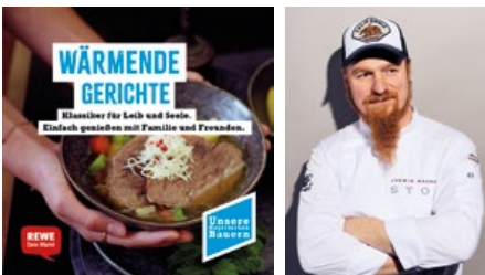
Broschüre mit REWE

Auch bei Thermomix wird das erste gemeinsame Projekt eine Broschüre. Thermomix, die smarte Küchenmaschine von Vorwerk, wird bei Familien immer beliebter – auch für UBB eine wichtige Zielgruppe. Grund genug für uns, um anzuklopfen. Mit Erfolg! Die Broschüre wird Thermomix-Rezepte für Familiengerichte bieten, dazu viele Infos zur heimischen Erzeugung. Verteilung: über die Thermomix-Regionalvertreter:innen. Geplante Startauflage: 6-stellig.